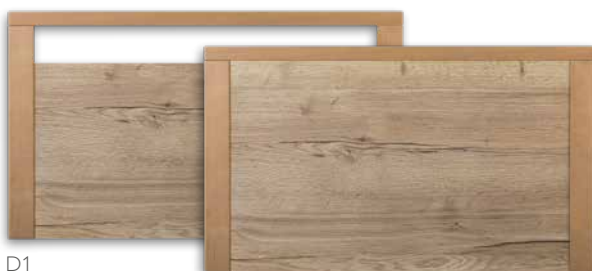
Serie V480 1 2

D1 geeignet für durchgehendes Seitengitter (DS), schwenkbares Seitengitter (GS) und vertikales Seitengitter (VGS/EVGS)