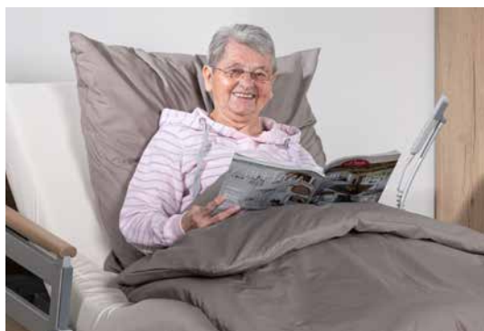
1 ausgenommen Edition 420

Die Trendelenburg-Position 1 (5) kann zur Stabilisierung von Kreislaufproblemen beitragen. Die elektromotorische Verstellung in die Kopftieflagerung ermöglicht dem qualifizierten Personal im Notfall schnelles Handeln.