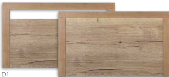
Serie V470 1 2

D1 geeignet für durchgehendes Seitengitter (DS), schwenkbares Seitengitter (GS) und vertikales Seitengitter (VGS/EVGS)