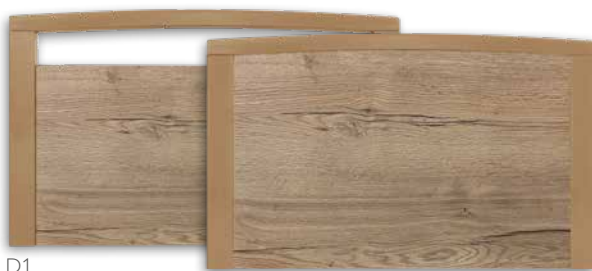
Serie V455 1 2

geeignet für schwenkbares Seitengitter (GS) und vertikales Seitengitter (VGS/EVGS)