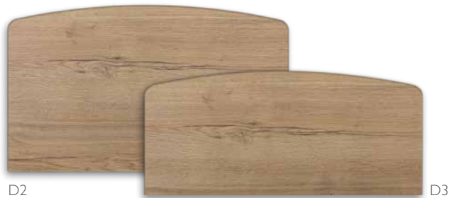
Serie V408 2