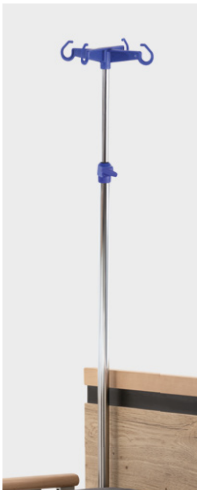
Infusionsstativ gerade Kunststoff Artikel-Nr. V80300000001