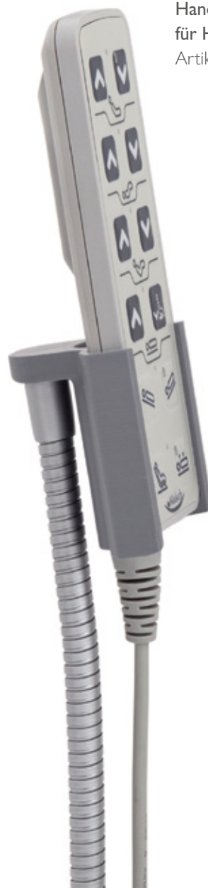
Handschalter-Halterung für HB 400, Kunststoff Artikel-Nr. PMF81900000008