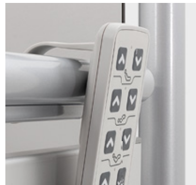
Handschalter-Haken für HB 400 zum Einhängen an das Seitengitter, Kunststoff Artikel-Nr. E22400103000