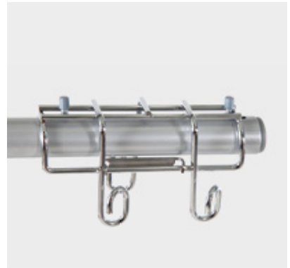
Infusionsspanne für Aufrichter verchromt Artikel-Nr. V81110000001