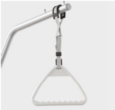
Standard-Haltegriff Artikel-Nr. E21700101000