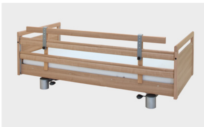
Seitengittererhöhung Artikel-Nr. V701001