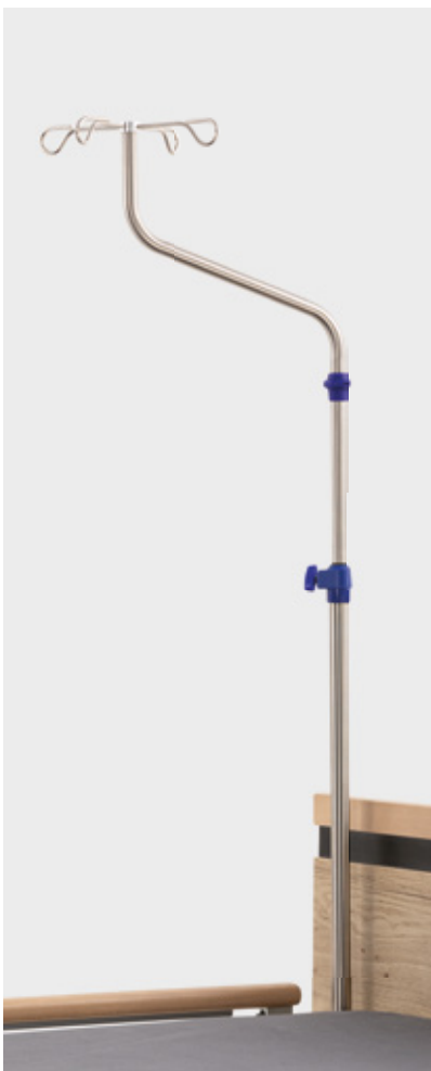
Infusionsstativ gebogen Edelstahl Artikel-Nr. V80300000002