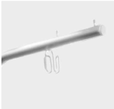
Aufrichter mit Infusionshalter RAL 9006 (silber) Artikel-Nr. V50200000007