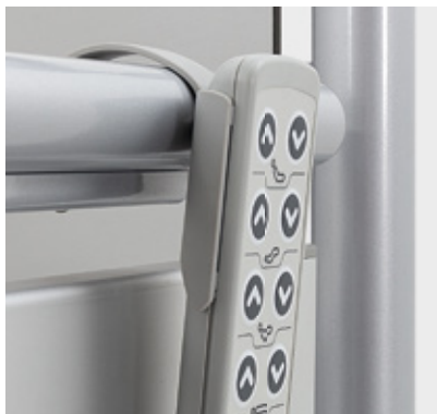
Handschalter-Haken für HC-146/147 zum Einhängen an das Seitengitter, Kunststoff Artikel-Nr. E22400102000