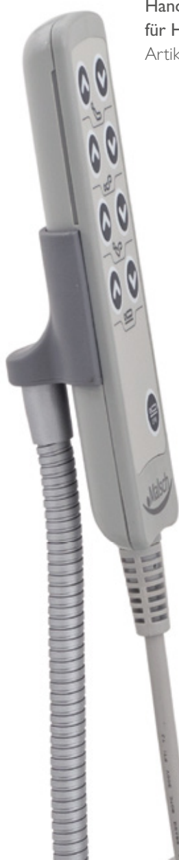
Handschalter-Halterung für HC-146/147, Kunststoff Artikel-Nr. V81900000002