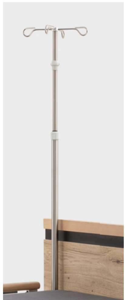
Infusionsstativ gerade Edelstahl Artikel-Nr. V80300000000