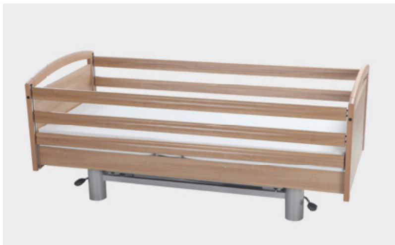
Durchgehendes Seitengitter 3-teilig Artikel-Nr. E6050010