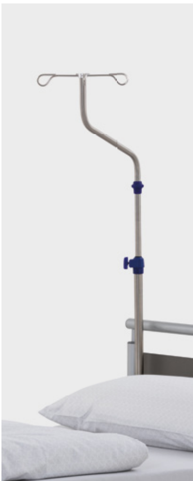
Infusionsstativ gebogen Edelstahl Artikel-Nr. V80300000002