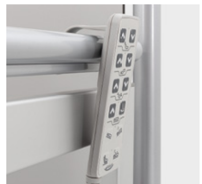
Handscharter-Haken für HB 400 Kunststoff, Artikel-Nr. E22400103000