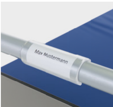
Namensschild-Halterung für Rundrohr Artikel-Nr. V81110000011 für Ovalrohr Artikel-Nr. V81110000004