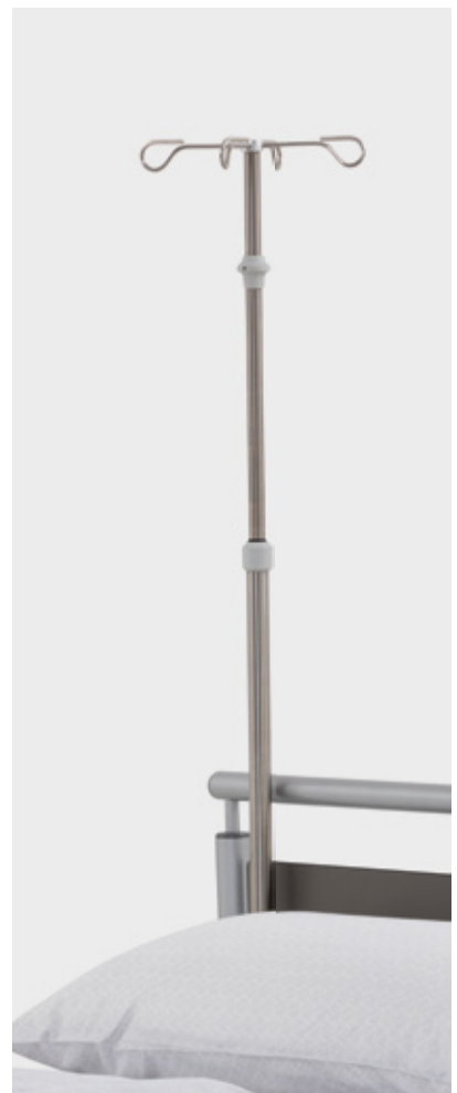
Infusionsstativ gerade Edelstahl Artikel-Nr. V80300000000