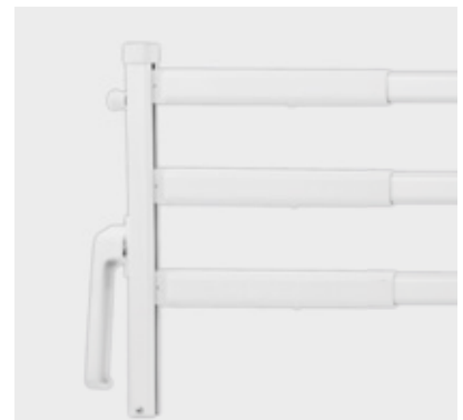
Durchgehende Seitensicherung s. u. mit 3 Holmen, Kunststoff/Stahl Ausführung, nur in Verbindung mit Bettfront V1120/1140 und V2120/2140 Artikel-Nr. M90800002002