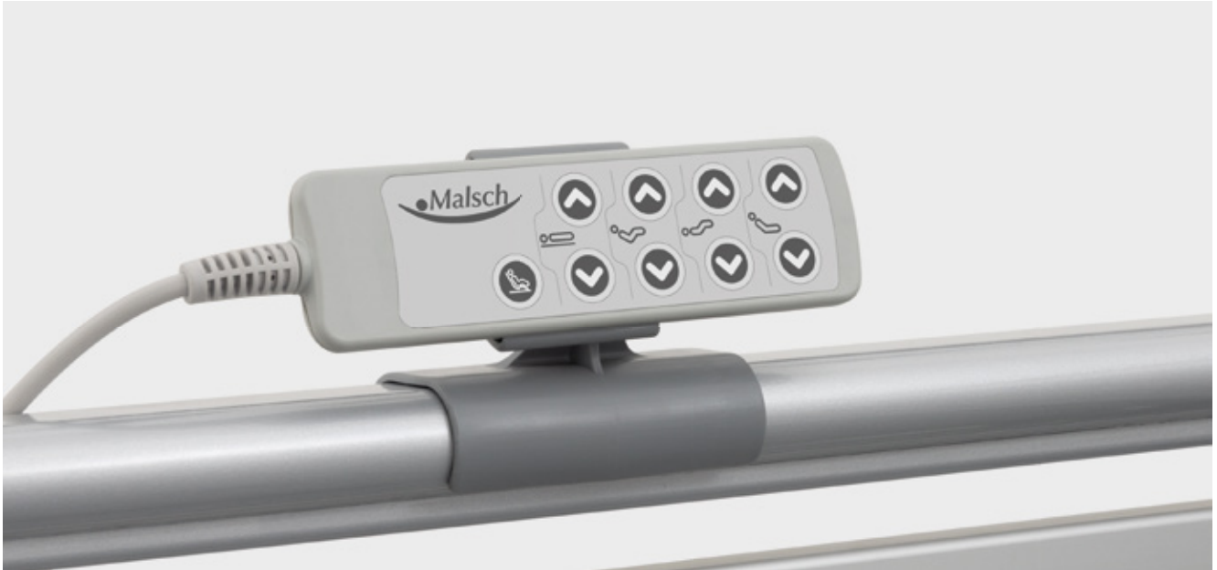
Handscharter-Halterung für HC-146/147, horizontal, Kunststoff Artikel-Nr. V8190000003