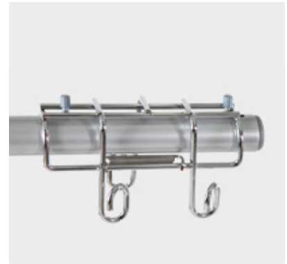
Infusionsspanne für Aufrichter verchromt Artikel-Nr. V81110000001