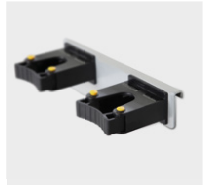
Gehhilfen-Halterung für HPL-Füllplatte Artikel-Nr. V81110000021