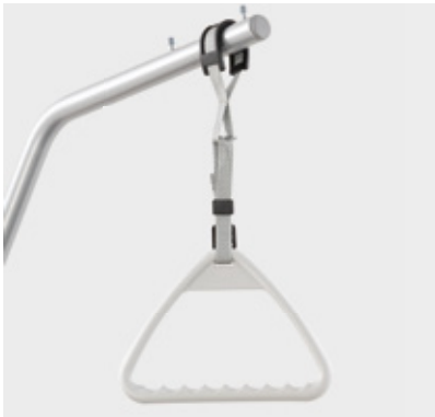
Standard-Haltegriff Artikel-Nr. E21700101000