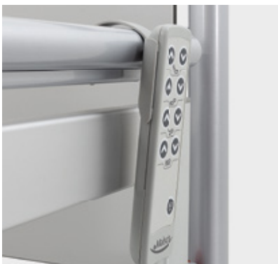
Handscharter-Haken für HC-146/147 Kunststoff, Artikel-Nr. E22400102000