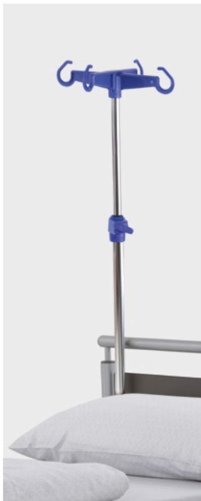
Infusionsstativ gerade Kunststoff Artikel-Nr. V80300000001