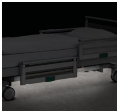
Unterbettbeleuchtung Artikel-Nr. V80200400002