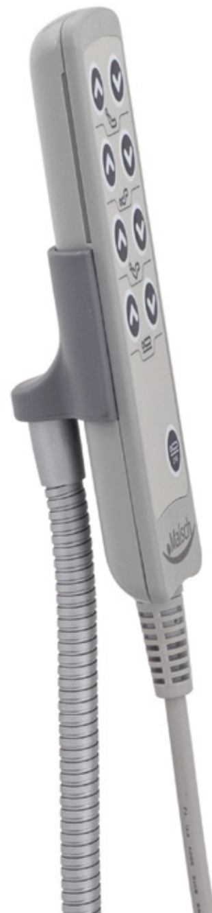
Handscharter-Halterung für HC-146/147, vertikal, Kunststoff Artikel-Nr. V8190000002