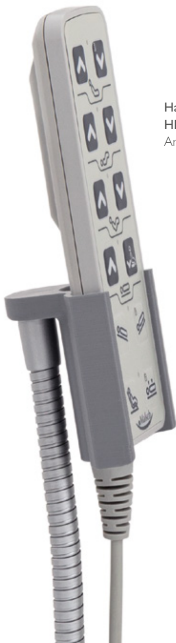
Handscharter-Halterung für HB 400, vertikal, Kunststoff Artikel-Nr. PMF8190000008