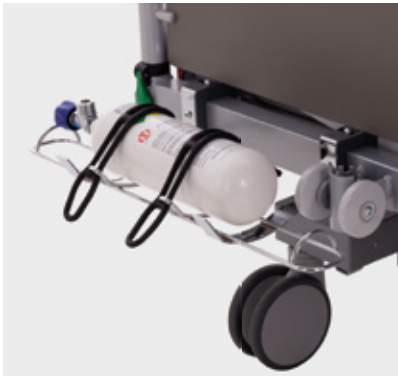
Sauerstoffflaschen-Halterung liegend Artikel-Nr. V81100100004