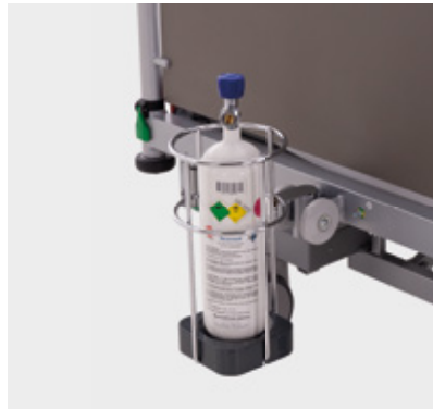
Sauerstoffflaschen-Halterung stehend Artikel-Nr. V81100100003