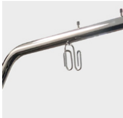
Aufrichter mit Infusionshaken verchromt Artikel-Nr. E71600104001