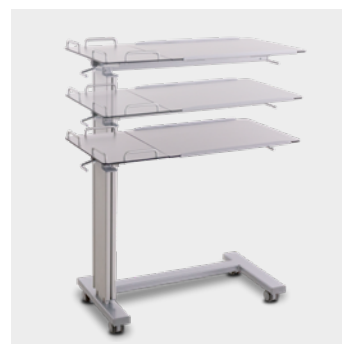
Server WX L