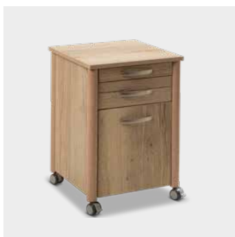
Nachtkastje W IV