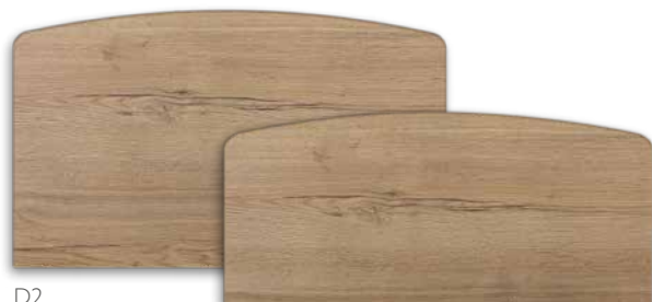
Serie V408 2

Kies het geschikte bedfront uit verschillende designs. Deze kunt u combineren met fraaie houtlookdessins. Bij het vormgeven van uw project kunt u uw creativiteit dus de vrije loop laten.