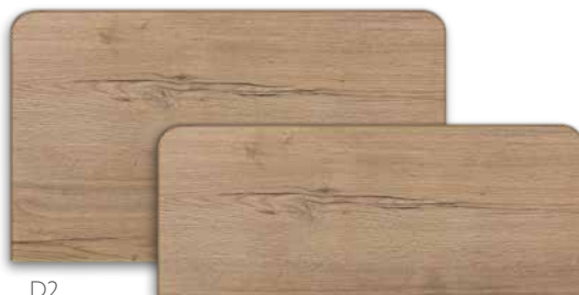
Serie V420 2