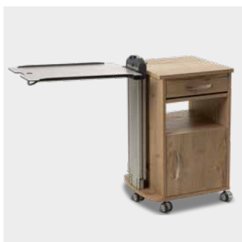
Nachtkastje W III