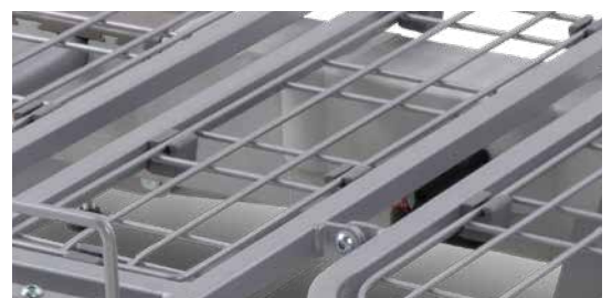
Metalen raster ligvlak